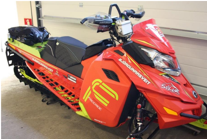
Dæmi um útfærslu á merkingu björgunarsveitar.