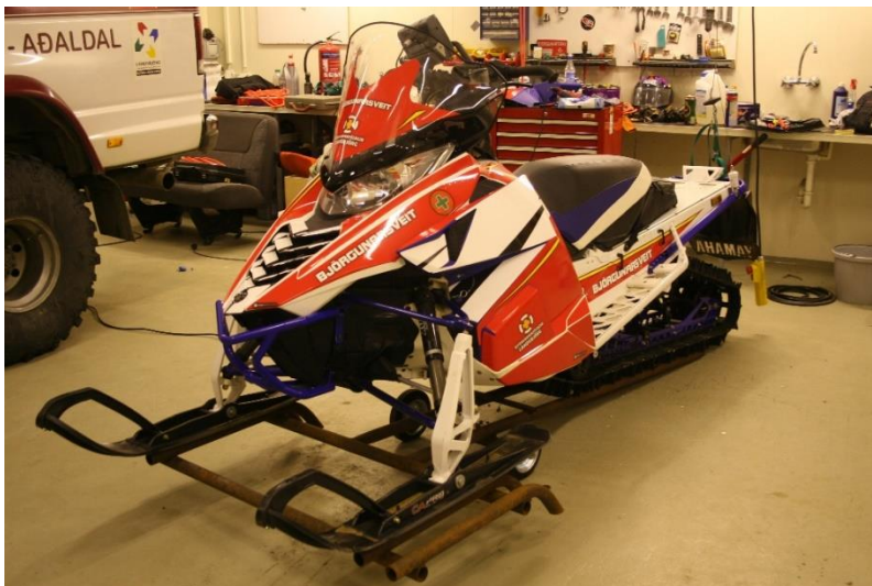
Dæmi um heilmerkta vélisleða.